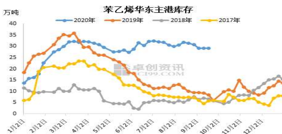
图 1：苯乙烯库存逐步走低

今年以来，苯乙烯持续高位，4 月份由于生产装置集中检修与下游需求回补国内疫情期间订单，苯乙烯小幅去库，而在 7-8 月下游需求转好与进口阶段性放缓，库存又有所下降，但仍处于历史高位，后期随着进口船货到港预期减少，叠加金九银十需求旺季的到来，业内多认为 9 月份主港有持续去库可能。据卓创预测，9 月苯乙烯产量约 90.4 万吨，较 8 月份 90.7 万吨减少 0.3 万吨。预计 9 月份华东主港周平均到货量在 3.5 万吨附近，且中下旬有去库可能。从 6 月份开始，库存的上涨一直是压制苯乙烯价格的主要原因。不过，随着后期库存将进入新一轮下行周期，对应的，苯乙烯的价格可能将进入一年中的上行周期。